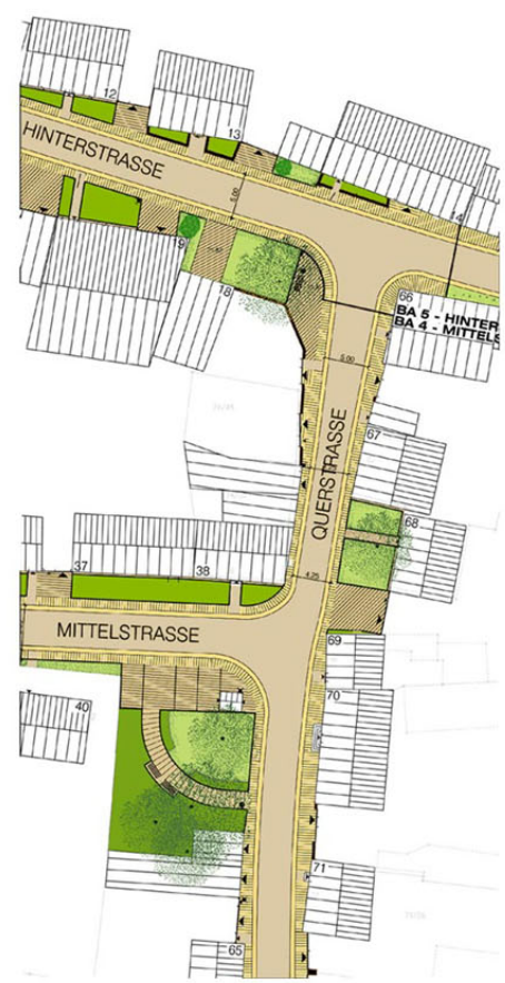
Planauszug BA 4 / BA5