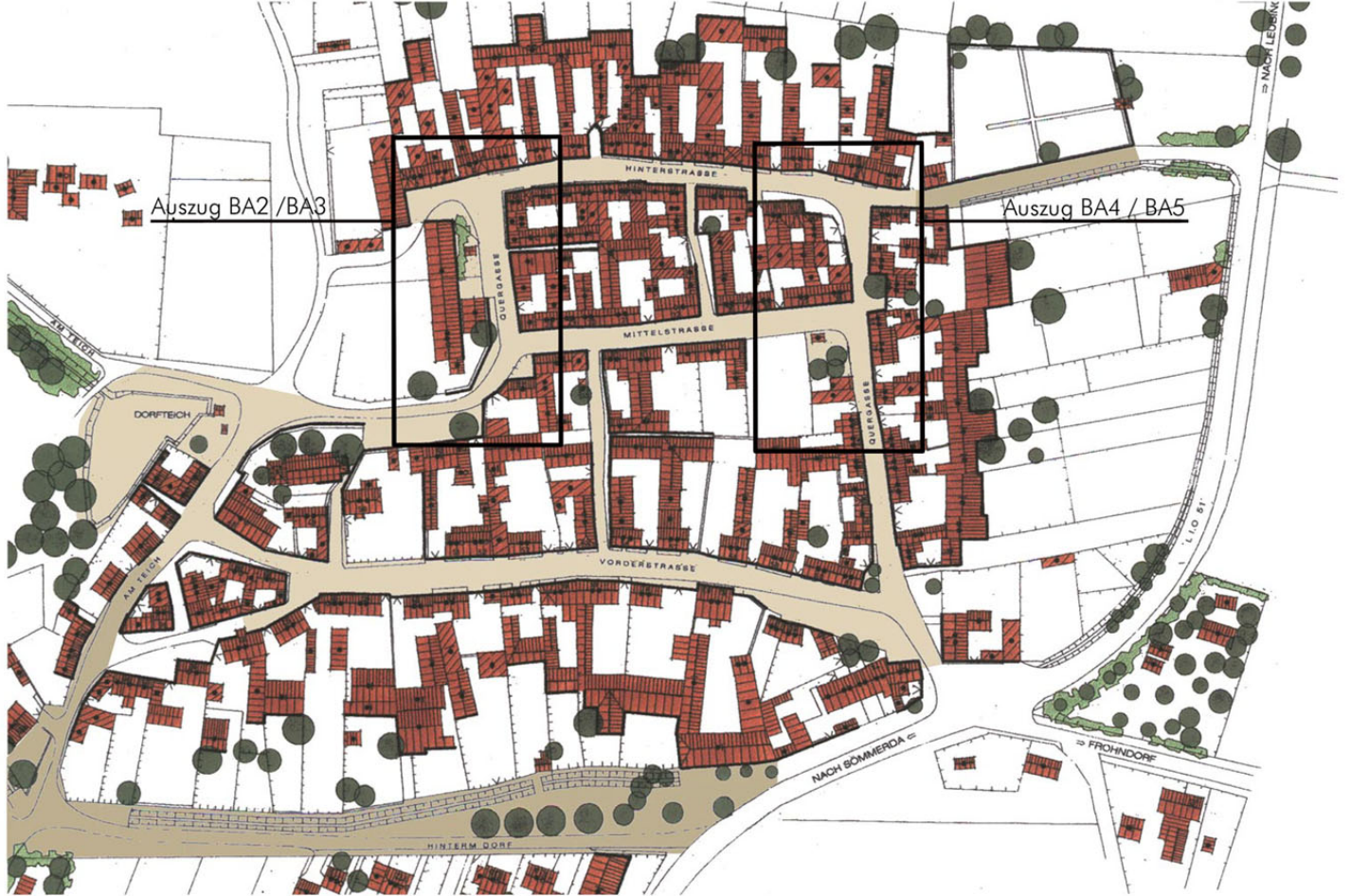
Ortsgrundriss - Übersicht der beplanten und baulich realisierten Bereiche