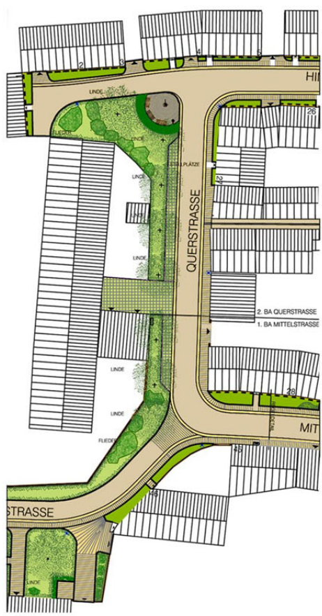
Planauszug BA2 / BA3